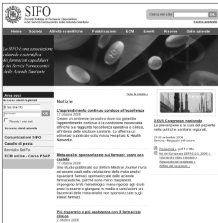
Figura 5. Il nuovo sito della SIFO.

clinica. Particolare attenzione sarà data al contenuto dei bollettini aderenti alla International Society of Drug Bulletins, italiani (Ricerca & Pratica e Dialogo sui Farmaci) e internazionali (in primo luogo Prescrivere e The Medical Letter).