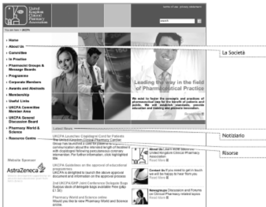
Figura 4. UK Clinical Pharmacy Association.