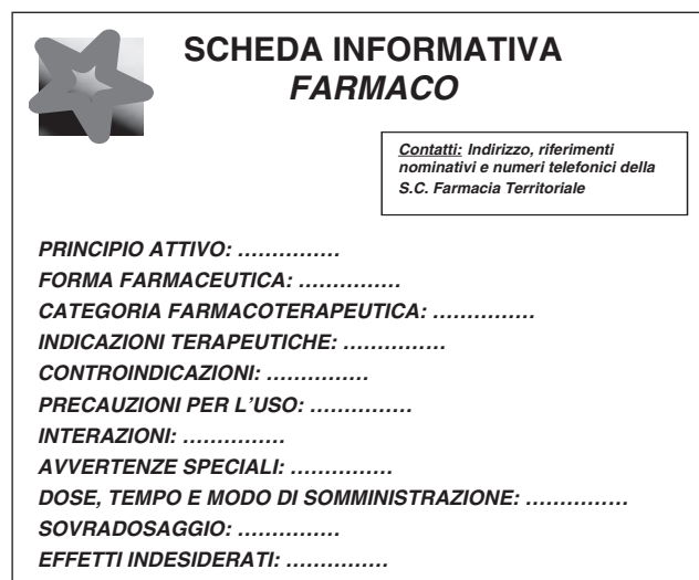
Figura 3. Modello di scheda informativa sui farmaci

I pazienti soggetti a cure palliative sono stati 44: 22 maschi e 22 femmine, di età compresa tra 7 e 86 anni (età media: 66 anni). La durata media degli ADI per cure palliative è stata di 44 giorni (da 3 a 180) e in tutti i casi l'assistenza è terminata in seguito al decesso del paziente. Tutti i pazienti, eccetto uno, hanno avuto necessità di assistenza palliativa a seguito di patologia tumorale avanzata (polmone, mammella, gastrico). Dall'analisi delle prescrizioni risulta che gli analgesici oppioidi (N02A) sono i farmaci maggiormente prescritti con un totale di 113 prescrizioni (48,67% di fentanil transdermico), seguiti dai farmaci antinfiammatori-antireumatici non steroidei (M01A) con 90 prescrizioni (66,66% di ketorolac parenterale) e, infine, da altri analgesici (N02B) con 5 prescrizioni (totalità di associazione paracetamolo-codeina fosfato orale). Nonostante gli oppioidi siano stati la categoria di analgesici più prescritta, l'utilizzo di morfina risulta limitato rispetto al fentanil transdermico. Di interesse clinico rilevante si è, inoltre, riscontrato un eccessivo utilizzo di ketorolac parenterale per periodi prolungati.