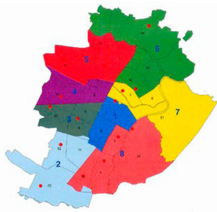
Figura 1. Suddivisione del territorio ed aree di competenza delle F.O. dell'ASL Città di Torino.

I farmacisti dei vari presidi hanno riorganizzato le attività di distribuzione diretta secondo una linea comune, collaborando con associazioni di volontariato (fondamentali) e altre figure professionali aziendali dell'ASL Città di Torino (Figura 2). Questo ha consentito di evitare gli afflussi in ospedale garantendo la continuità di servizio e prosecuzione terapeutica direttamente al domicilio del